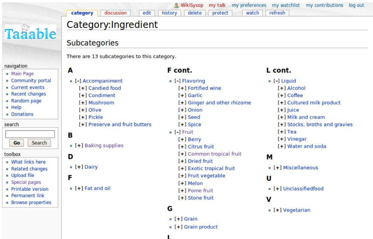
FIG. 5 – L'ontologie des ingrédients représentée sous WIKITAAABLE.