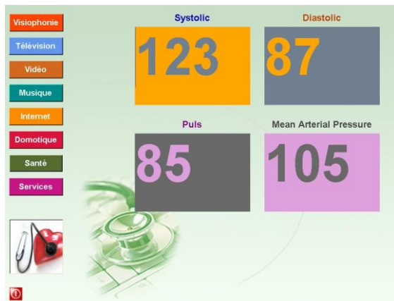
Figure 2: Interface utilisateur – Partie Santé

D'autre part, le projet s'est attaché et s'est concentré à développer une interface ergonomique et simple d'utilisation, garantissant un niveau maximum d'appropriation de la part des utilisateurs. L'interface, son accessibilité et son ergonomie ont été respectées au plus prêt des attentes et remarques des utilisateurs analysées en amont du développement de l'interface et ont démontrées le grand degré d'importance dans ce type de développement. Figure 2 montre la partie santé (mesure de la tension artérielle du résident) de l'interface utilisateur de notre système.