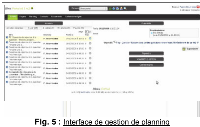
Fig. 5 : Interface de gestion de planning

coopération. Un moteur de recherche évolué, basé sur l'indexation de l'ensemble des contenus et contexte, permet l'interprétation de recherche à l'aide de parenthèse et d'opérateurs booléens. Il propose également la possibilité de mettre en surveillance une demande spécifique afin d'analyser les nouvelles informations saisies (cf. Fig. 5, 6).