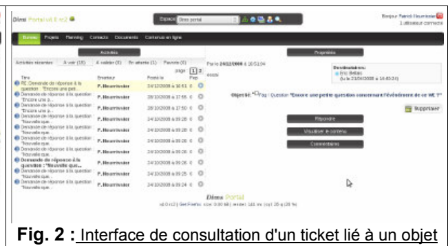
Fig. 2 : Interface de consultation d'un ticket lié à un objet

L'objectif principal est d'améliorer et de minimiser les échanges d'information (éviter l'asphyxie des messageries), tout en mettant en avant le contexte dans lequel les annotations ont été produites. Une différenciation entre l'action à produire et l'information à voir est mise en évidence, afin de gagner en efficacité et surtout favoriser la collaboration entre les acteurs (cf. Fig. 3, 4).