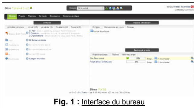
Fig. 1 : Interface du bureau

Cet outil s'adapte au modèle organisationnel de votre structure, en proposant la création d'espaces de travail (cf. Fig. 1, 2). Chaque espace peut créer ses propres briques métiers, appelées modules, ou utiliser des modules partagés. La collaboration s'effectue à l'aide de ces espaces de travail où chaque information bénéficie de fonctions simples de collaboration.