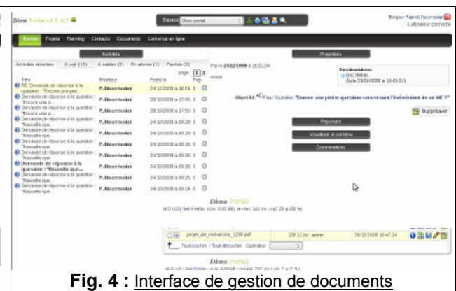
Fig. 4 : Interface de gestion de documents

Quelques éléments clés ont été développés, tels qu'un planning et une gestion de projets, dans l'esprit de la