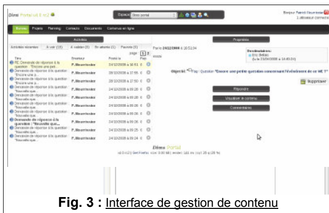
Fig. 3 : Interface de gestion de contenu

L'objectif principal est d'améliorer et de minimiser les échanges d'information (éviter l'asphyxie des messageries), tout en mettant en avant le contexte dans lequel les annotations ont été produites. Une différenciation entre l'action à produire et l'information à voir est mise en évidence, afin de gagner en efficacité et surtout favoriser la collaboration entre les acteurs (cf. Fig. 3, 4).