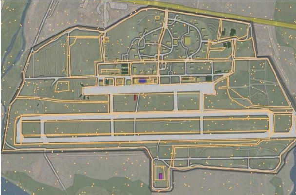
FIG. 1 – Modélisation de la base militaire utilisée (avec réseau de capteurs au sol).