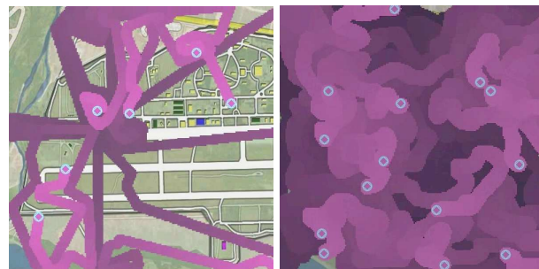
FIG. 4 – Patrouille de la base par un ensemble de drones déposant une phéromone de visite (couleur claire représente une quantité maximum).

Au niveau de l'environnement, chaque cellule possède désormais un taux d'évaporation \rho_x propre permettant de modifier dynamiquement la vitesse d'évaporation de certaines cellules, permettant de créer des zones de priorité.