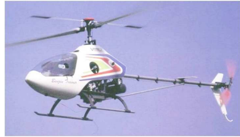
FIG. 2 – Drone hélicoptère (PY Automation).

Le partage d’autorité décrit dans cet article est