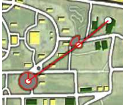
FIG. 6 – Représentation d’une intrusion : plus un camembert est plein plus le contact est récent

De même que pour le déploiement dans l’activité de patrouille (section précédente), l’opérateur dispose de deux modes non exclusifs aux niveaux 1 et 10 : les DVT sont dirigés manuellement par des balises ou bien suivent l’algorithme de phéromone (ici phéromone d’alarme). Toutefois, l’activité de poursuite compte un mode intermédiaire supplémentaire évalué à 5. Il correspond à la possibilité de diriger les DVT sur des objets intermédiaires : des contacts ou des intrusions. Ainsi il est possible de diriger un ou plusieurs DVT sélectionnés sur un contact, mais aussi d’affecter un groupe de DVT à une intrusion, auquel cas les engins se répartissent le long de l’intrusion en privilégiant les zones les plus récentes.