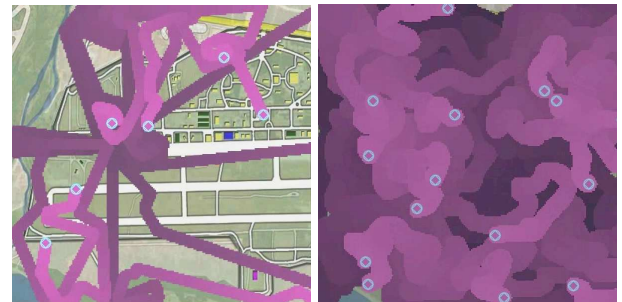
FIG. 4 – Patrouille de la base par un ensemble de drones déposant une phéromone de visite (couleur claire représente une quantité maximum).

Au niveau de l'environnement, chaque cellule possède désormais un taux d'évaporation \rho_x propre permettant de modifier dynamiquement la vitesse d'évaporation de certaines cellules, permettant de créer des zones de priorité.