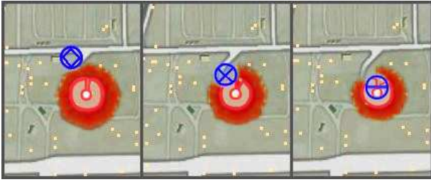
FIG. 5 – Illustration de l'utilisation de la phéromone d'alarme par un drone.

Le processus d'évaporation joue également un rôle important puisqu'il détermine la durée de vie d'un signal d'alarme. En effet, si le signal disparaît avant que les drones n'aient consommé l'ensemble de la phéromone ceux-ci reprennent la tâche de patrouille sans avoir pu exploiter pleinement la trace laissée préalablement. À l'inverse, il est inutile et même pénalisant de conserver une information obsolète qui mobilisera des agents pour retrouver un intrus qui s'est déjà éloigné de la zone de recherche. Nous avons pu établir analytiquement la valeur Q_{max} et le taux d'évaporation pour dimensionner efficacement la propagation de la phéromone d'alarme.