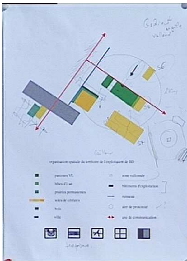
FIG. 1 – Représentation chorématique d’une exploitation agricole en Lorraine.

de deux ensembles de sommets, l’un représente des entités, l’autre des relations. Les sommets-entités et sommets-relations peuvent être regroupés en concepts auxquels sont associés des attributs. Les arêtes du graphe sont étiquetées par le rôle 2 des entités dans la relation. Nous utilisons les graphes pour modéliser les chorèmes en supposant que :