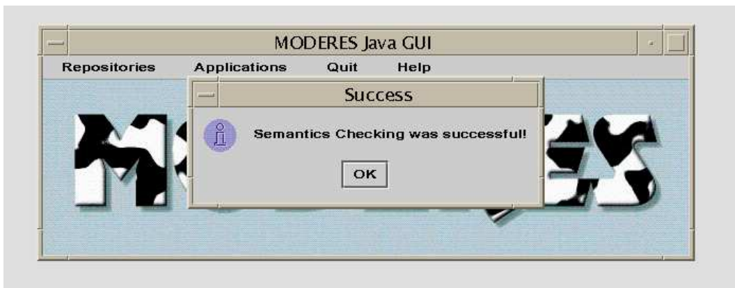
FIG. 3 – Analyse sans erreurs détectées