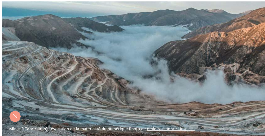
Mines à Tabriz (Iran) : évocation de la matérialité du numérique

Point de situation, contexte et enjeux, l'état des lieux est sans appel : les limites sont dépassées !