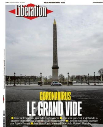
« Une » de Libération le 18/03/21