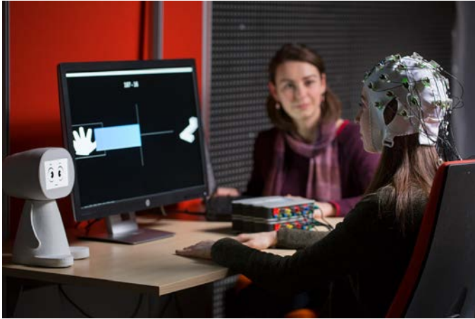
Figure 2 : Utilisation d'un compagnon d'apprentissage artificiel (à gauche sur l'image), baptisé PEANUT, pour encourager et motiver l'utilisateur à persévérer dans son entraînement au contrôle d'une ICO.