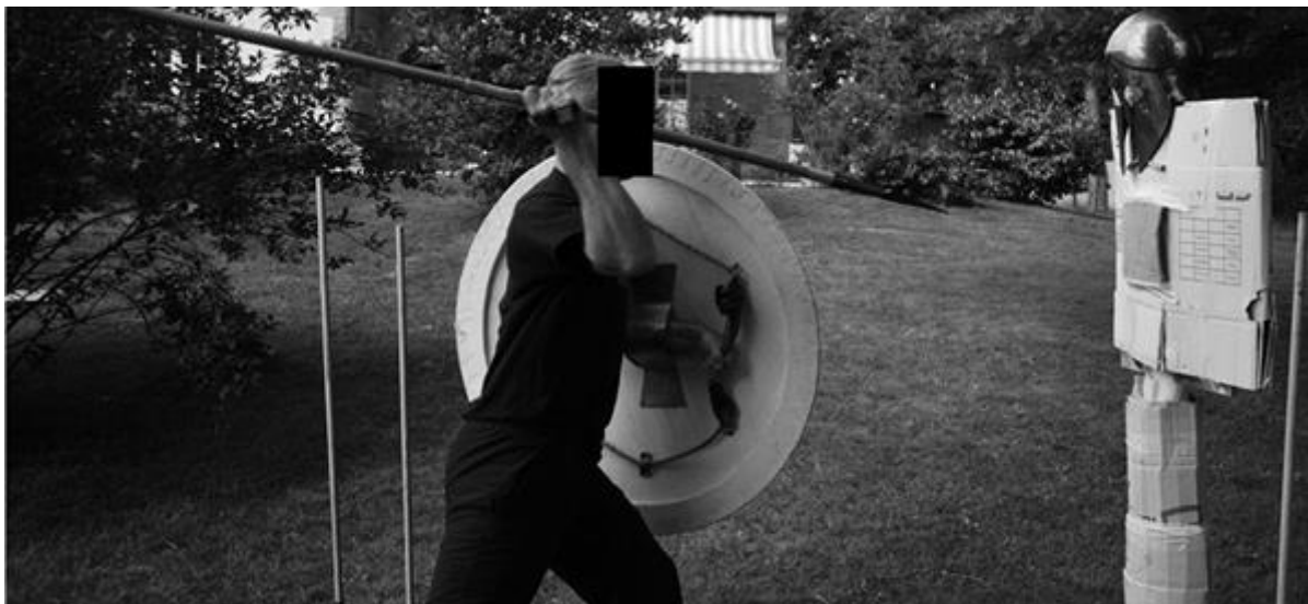
FIGURE 4: Protocole expérimental d'étude des protections. Le sujet était placé à une distance de frappe optimale de la pièce de protection, et frappait avec le maximum de précision et d'efficacité possible la pièce en respectant les postures d'attaque issues du corpus de Paestum.

Les pièces de protection ont été montées sur un mannequin et le sujet (taille 1.78m, poids 70kg, pratique de l'art martial antique 2h par semaine) avait pour consigne de frapper avec la meilleure efficacité possible les pièces de protection à l'aide des répliques de lance présentées ci-dessus. Une illustration du protocole expérimental peut être trouvée figure 4. La main du sujet a été équipée d'un accéléromètre permettant d'estimer, à l'aide du poids de la lance et du poids estimé du bras du sujet, la quantité d'accélération de l'ensemble en mouvement. L'équilibre dynamique global du sujet nous permet alors d'estimer que cette quantité d'accélération est égale à la force à l'impact en première approximation.