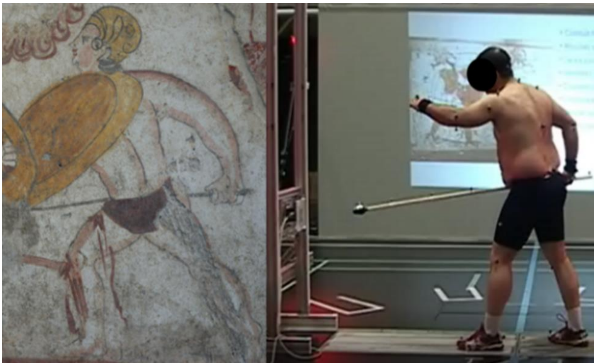
FIGURE 1: (gauche) Exemple de peinture représentative d'une attaque basse, en posture basse, réalisée à l'aide d'une lance. (droite) Posture initiale d'un essai expérimental, basée sur la représentation de gauche. Le sujet frappe un capteur de force, et est équipé de marqueurs de capture du mouvement.

Un sujet a reproduit l'ensemble des postures choisies pour réaliser des attaques sur un dispositif de frappe permettant de mesurer la force développée par l'attaquant lors de l'impact (capteur MC3A, AMTI). De surcroît, le mouvement du sujet était mesuré à l'aide d'un dispositif de capture de mouvements (VICON, 24 caméras). L'orientation de l'arme était également mesurée à l'aide du même dispositif.