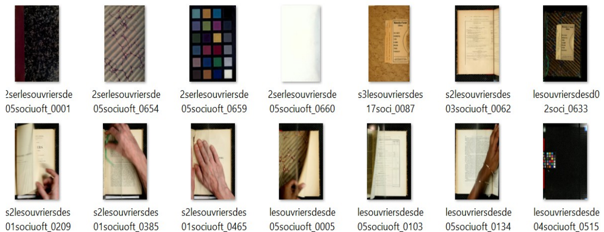
Fig. 1: Quelques erreurs de numérisation

Le corpus rassemblé est un mélange d'archives économiques et d'archives juridiques, manuscrites et imprimées et produites à différentes époques. Dans un premier temps, nous avons souhaité utiliser des sources déjà numérisées résultant de campagnes de numérisations menées par d'autres institutions. Numelyo 7 , la bibliothèque numérique de la ville de Lyon, permet le téléchargement des numérisations des microfilms de la presse lyonnaise du XIXe siècle. Nous avons collecté un total de 390 fichiers PDF par son biais. L'Université de Toronto a publié sur Internet Archive 8 les numérisations de treize volumes appartenant à la série des « Ouvriers des Deux Mondes ». Près de 8 000 fichiers couleurs au format JP2 sont ainsi disponibles. En dépit de la très bonne qualité de ces fichiers, l'ensemble contient des erreurs de numérisation ou des images jugées inutiles pour le projet, qu'il a donc fallu trier.