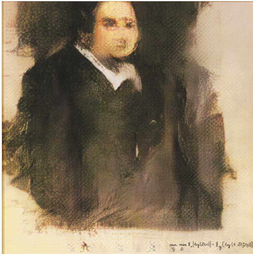
Le Portrait d' Edmond de

[caption id="" align="aligncenter" width="411"]