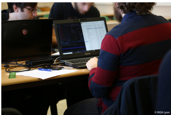
FIGURE 2. Des étudiants sur le campus de l'INSA de Lyon durant la seconde phase dédiée à la ré-identification des jeux de données anonymisés des autres groupes.

L'ensemble des métriques étaient implémentées via des scripts python. Grâce à ces métriques, les étudiants ont pu donc itérativement améliorer leur mécanisme de protection. Cette première phase s'est achevée mi Novembre.