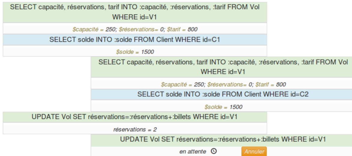
Fig. 2 : Les deux transactions veulent réserver au même moment un billet d'avion. Dans le niveau de sécurité Repeatable Read, le Update de la transaction 1 verrouille la table Vol. La transaction 2 est alors en attente.

try: # Select and return vol for connection connection_id getattr(self, "cursor_{0}".format(connection_id)).execute('SELECT id, placesDispo, placesPrises, tarif FROM vol') return getattr(self, "cursor_{0}".format(transaction_id)).fetchone() # timeout except _mysql_exceptions.OperationalError: self.set_status_unavailable_for(connection)