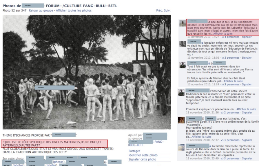
Illustration 1. Fil de discussion sur les règles de la parenté chez les Bèti dans l'un des groupes dédiés aux "Fang-Bulu-Bèti" 1 .

Loin des conversations légères que nous pourrions imaginer sur les réseaux sociaux, ce sont des discussions approfondies et des productions textuelles ou iconographiques sérieuses et sophistiquées qui ont attiré notre attention, traitant de la façon de parler correctement l'éton (pour combler les fractures générationnelles et géographiques), ou des bonnes façons d'écrire cette langue. Des débats redondants et animés sont entretenus à propos de l'étymologie, des formes de sociabilité, des rituels, de l'histoire, de la généalogie, de la pharmacopée, des structures politiques et lignagères, des informations d'actualité régionale, ... Concrètement, ces échanges écrits traitent régulièrement de la définition du groupe ethnique lui-même, s'emparant y compris des débats classificatoires d'anthropologues et linguistiques, et allant jusqu'à réaffirmer l'autorité du natif sur les observations d'ethnographes reconnus.