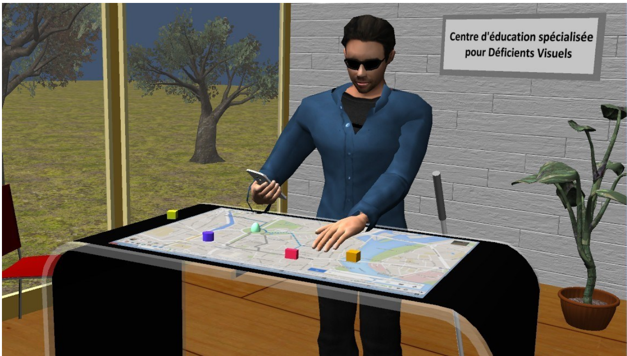
Figure 3: Projet AccessiMap : exploration tactile, tangible et multi-supports (par ex depuis son smartphone personnel) de données spatiales