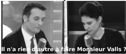
(b) Interview BFM