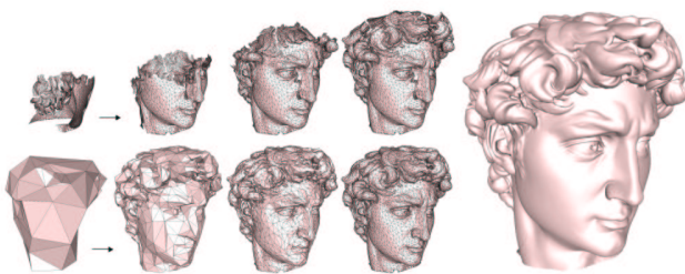
FIG. 2 – Les étapes intermédiaires de reconstruction d'un modèle pendant la décompression d'une technique mono-résolution (en haut) ou progressive (en bas).

L'idée de compression progressive des maillages implique la notion de raffinement : le maillage original est modélisé sous la forme d'une séquence de raffinements à partir d'un maillage de base arbitrairement simple. Au cours du décodage la connectivité du maillage est reconstruite à partir des informations de raffinement, et la géométrie est reconstruite par prédiction suivie de termes correctifs. Le principal intérêt réside ainsi dans l'accès à des reconstructions intermédiaires d'un objet au cours de sa transmission (voir Figure 2). L'enjeu consiste alors à reconstruire un objet aussi fidèle que possible à l'original tout au long de la transmission, on parle aussi d'optimisation du comportement débit / distorsion. Les sections suivantes décrivent les principales approches, en focalisant notre attention sur les travaux et les résultats d'une compression effectuée sur la connectivité des maillages.