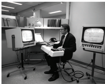
Bill English à la console Herman Miller, en 1968

Engelbart et son équipe s'attaquent ensuite à la réalisation d'un système logiciel utilisant ces dispositifs d'entrée pour produire et manipuler des connaissances. Ils s'appuient pour cela sur des éléments existants, comme le langage SNOBOL, mais étrennent également des principes d'ingénierie tels que la séparation entre interface et noyau fonctionnel ou la description de l'interaction par des machines à états