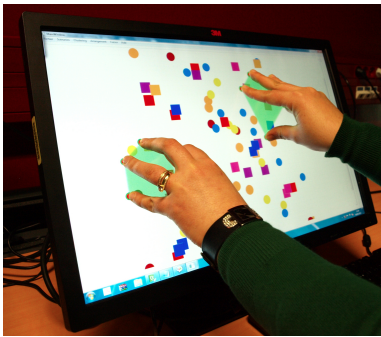
Figure 2 : Sélections de formes géométriques à l'aide de deux mouvements pseudo-rigides indépendants

Plusieurs mouvements pseudo-rigides peuvent être utilisés simultanément, à deux mains ou à plusieurs, pour créer des sélections d'objets indépendantes (Figure 2). Lorsqu'une fusion de mouvements indépendants est détectée, les sélections d'objets sont elles-aussi fusionnées. Pour ajouter un objet à une sélection commencée avec la main droite, on peut ainsi le sélectionner avec la main gauche et effectuer un mouvement identique avec les deux mains, par exemple. Lorsqu'un mouvement disparaît, la sélection qui lui était associée persiste et peut être reprise en initiant un nouveau mouvement sur l'un de ses objets. Lorsqu'un mouvement se divise, la sélection est par contre détruite et une commande de remplacement automatique des objets est optionnellement exécutée.