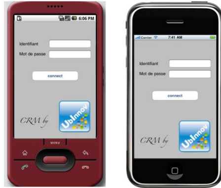
Figure 2. Application GRC, écran de connexion sur Android et iPhone.

Phase 2, génération de code. Les générateurs de code ont été développés sous la forme de gabarits Acceleo. Dans le cadre de cette démonstration, ce sont près de 1500 lignes de code qui sont générées. Après l'avoir modélisée et générée, l'application est entièrement fonctionnelle et n'a nécessité aucun ajout en termes de développement.