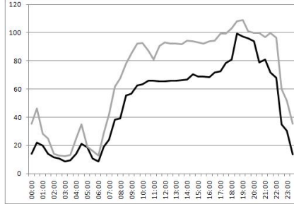
FIGURE 1: Charge vs Temps