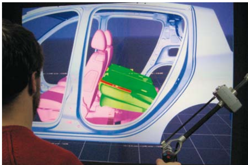
Fig. 2 : Deux ingénieurs coopèrent à distance pour concevoir le montage de la banquette arrière d'un véhicule (informations fournies par Renault): ils disposent chacun d'un bras à retour d'effort (à droite sur les photos).

La gestion de la latence n'est pas une question nouvelle: elle s'est posée dans les domaines de l'automatique et de la robotique (téléopération). Des méthodes de « compensation » ont été mises