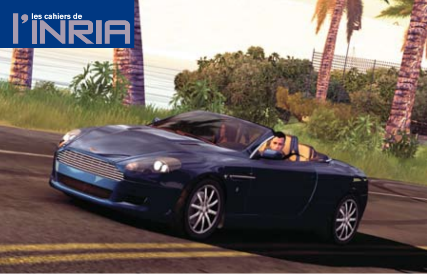
EDEN GAMES / ATARI

La sophistication croissante des jeux vidéo est à la mesure de l'ambition de leurs concepteurs qui les veulent de plus en plus réalistes, au plan sonore autant que visuel.