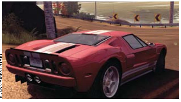
EDEN GAMES / ATARI