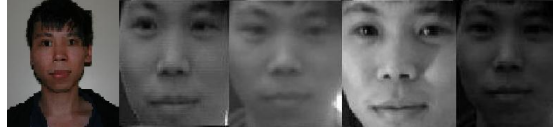
Figure 3. un échantillon de visage en différent phase de pré-traitement

formes: qui est utile pour la biométrie. Le nombre de descripteurs requis est souvent très élevé. Pour réussir une telle tâche, une réduction de dimension est nécessaire pour la convergence des estimateurs. L'application de la distance de Patrick Fisher trouve son intérêt dans ce type d'opération. La classification est ensuite opérée sur l'espace réduit.