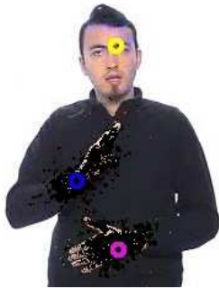
FIGURE 1 – Soustraction des nuages particulaires correspondant aux mains droite et gauche avant le suivi de la tête

A l'issue du processus de recuit, la position des mains est déterminée comme étant le centre de gravité des nuages de particules.