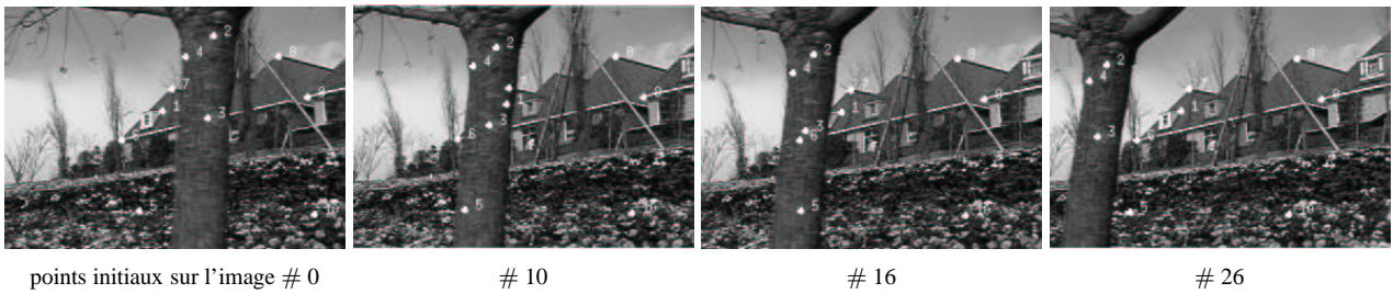
points initiaux sur l'image # 0 # 10 # 16 # 26