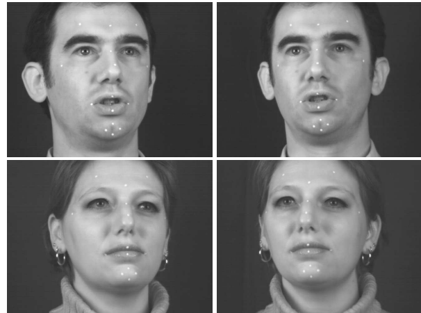
FIG. 2: Images en stéréovision de deux locuteurs, 15 marqueurs sont peints sur le visage de chaque locuteur.