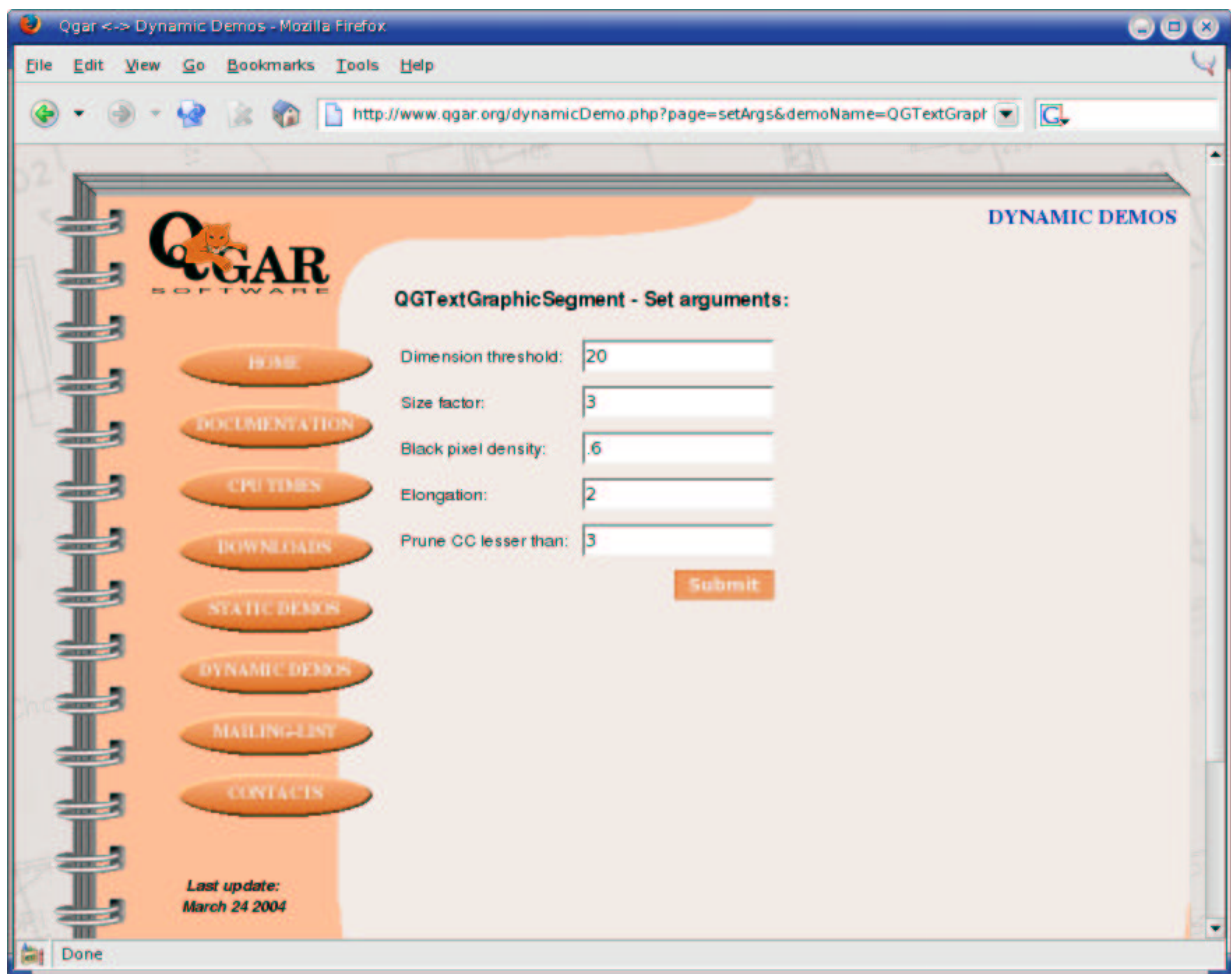
FIG. 4 – Formulaire HTML construit automatiquement pour la segmentation texte-graphique sur le site web du système Qgar.