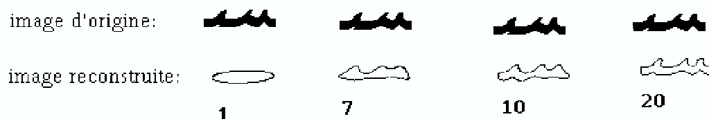
Figure 3. L'approximation du contour de la lettre « ssin » par les 20 premiers harmoniques

L'approximation du contour par les coefficients de Fourier peut être vue comme une superposition de formes elliptiques de différentes tailles, positions et orientations.