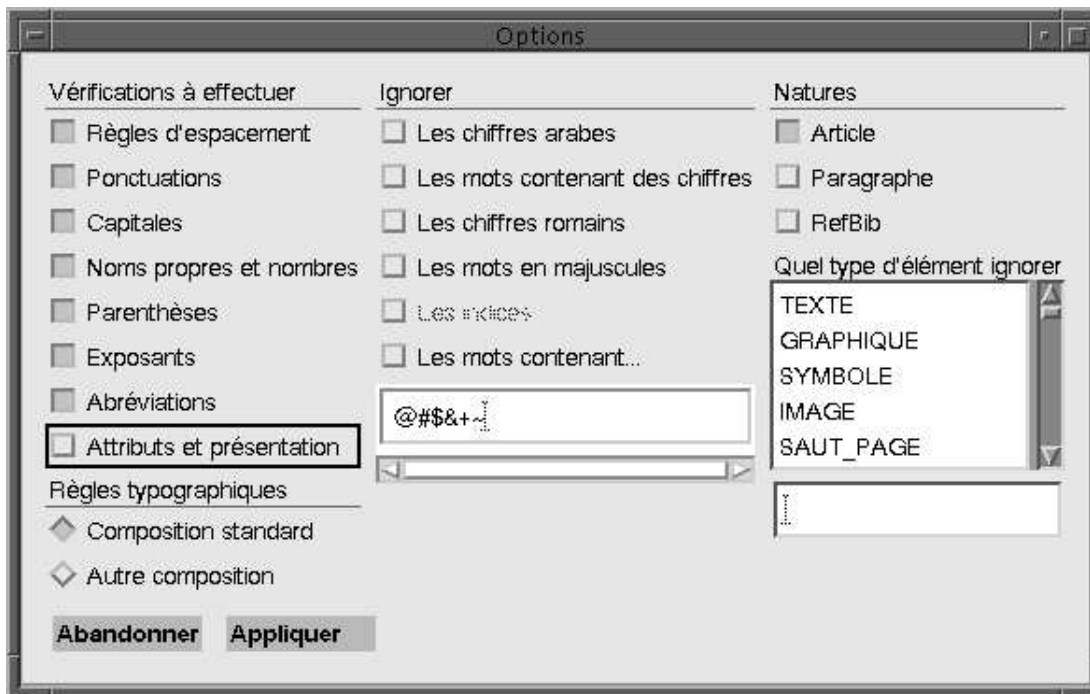
FIG. 8 - Fenêtre des options de la vérification typographique

Pour limiter la vérification typographique à certaines catégories de contrôle, il suffit de cocher une ou plusieurs options (en noir dans le formulaire). Pour changer de modèle de typographie, il suffit de cliquer sur « Autre composition ». L'interface permet également d'ignorer certains types d'éléments ou certains mots contenant des symboles particuliers. Toutes ces options sont modifiables à tout moment au cours de la correction.