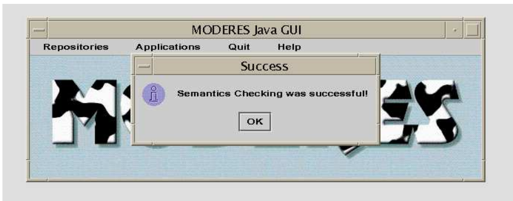
FIG. 3 – Analyse sans erreurs détectées