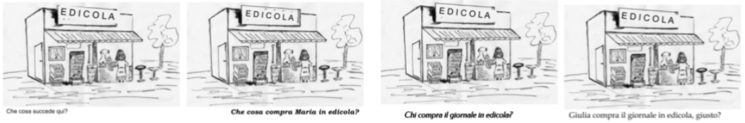
FIGURE 1 – Stimuli de la version italienne de la tâche.

phrase de référence. Ensuite, on passe aux diapositives suivantes, qui contiennent les mêmes images, accompagnées de différentes questions écrites. Des exemples de la version italienne sont illustrés à la page suivante, dans la Figure 1.