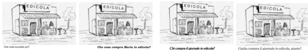
FIGURE 1 – Stimuli de la version italienne de la tâche.

phrase de référence. Ensuite, on passe aux diapositives suivantes, qui contiennent les mêmes images, accompagnées de différentes questions écrites. Des exemples de la version italienne sont illustrés à la page suivante, dans la Figure 1.