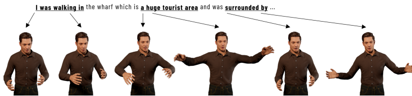
FIGURE 2 – Un exemple d’ECA utilisant des mouvements générés par STARGATE. Cet exemple illustre sa capacité à générer différents types de gestes, tels que des gestes iconiques.

et de ne pas pouvoir analyser une séquence complète de gestes. Par conséquent, nous n’avons pas pu utiliser les GRU bidirectionnels pour obtenir une compréhension approfondie de l’ensemble des séquences de gestes. Cependant, motivés par les avantages que cela pourrait apporter et comme nous générons des séquences de poses, nous pouvons utiliser les GRUs bidirectionnelles sur ces séquences partielles. L’introduction de ce mécanisme de bidirectionnalité locale a pour but de permettre au réseau d’apprendre la relation entre les informations passées et futures présentes dans la représentation multimodale.