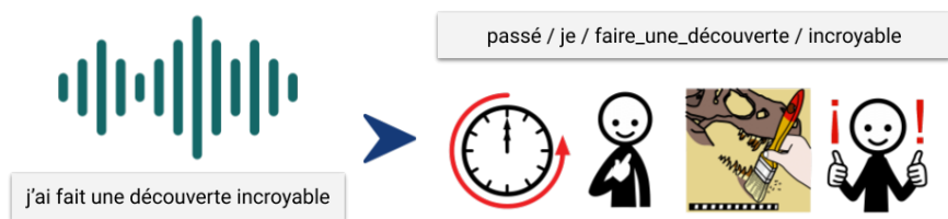
FIGURE 1 – Illustration de la tâche PAP avec la traduction d'un segment audio en pictogrammes ARASAAC.

Nous pensons que la mise en place de systèmes de traduction de la parole en une séquence de pictogrammes, tâche que nous appellerons Parole-à-Pictos (PAP), pourrait permettre de relever ces défis. Un système PAP prédit une suite de termes, chacun associé à un pictogramme unique ARASAAC 1 à partir d'un segment audio (cf. Figure 1). Notre objectif est de construire le premier système PAP pour le français.