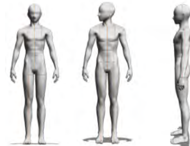
Figure 3 – Le mouvement progressif : position initiale, progressif droit, rétablissement.

Au cours de cette séance, Claire Heggen a offert une présentation de sa grammaire de la relation homme-objet au bénéfice des artistes mais aussi des développeurs. En effet, les concepts de sa grammaire, décrits plus haut, ne sont pas intéressants que pour les acteurs : la formalisation et la modélisation des gestes expressifs se prêtent très bien à une transposition « numérique » sur des humanoïdes comme Nao. Les concepts de mouvement progressif (Fig. 3), dégressif (Fig. 4), rétabli et contradiction (Fig. 5) ont