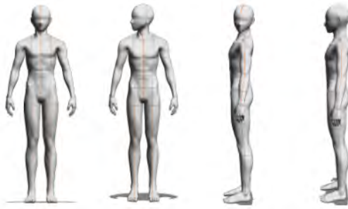
Figure 5 – Le mouvement en contradiction : position initiale, progressif droit, contradiction, rétablissement.

été repris dans le design et l'implémentation de nouveaux comportements pour le robot, en donnant lieu à des gestes de communication sociale très lisibles, pertinents et crédibles.