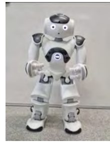
(a) Le robot Nao excité.