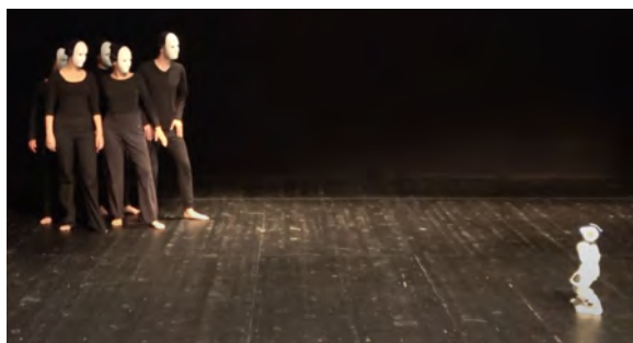
Figure 8 – Les acteurs masqués en tension dynamique avec le robot.

Dans la deuxième séquence, la grammaire de la relation corps/objet devient en revanche un outil pour créer une véritable narration. Nao est allongé au sol, au centre de la scène, éteint. Un acteur portant un masque neutre le découvre, s'en approche avec un mélange de méfiance, de crainte et d'irrésistible curiosité. Deux autres personnages masqués entrent en