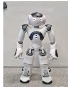
(a) Le robot Nao en regardant droit devant lui.

Le troisième atelier s'est concentré à affiner la dramaturgie et à renforcer l'alliance de la triade comédien-