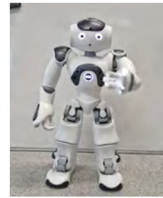
(b) Le robot Nao curieux.