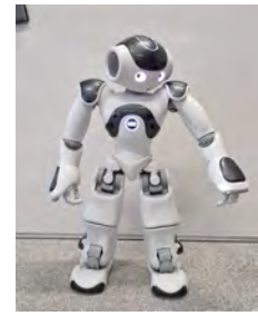
(b) Le robot Nao en indiquant sa gauche.