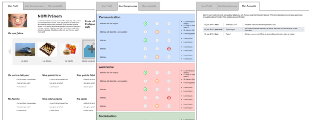
Figure 2 : Première maquette de l'outil TousEnsemble