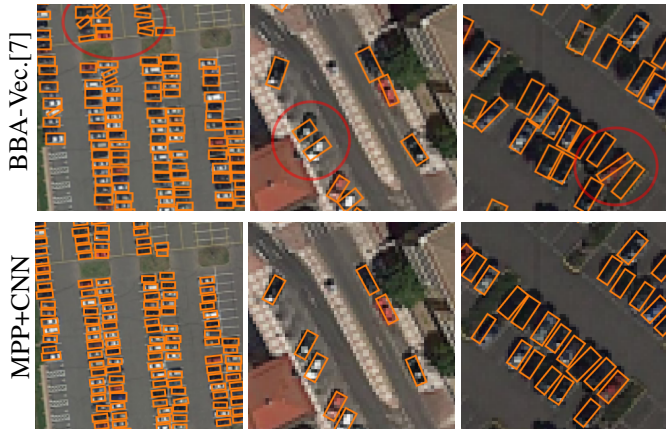
FIGURE 3 – Résultats sur des échantillons d’images.