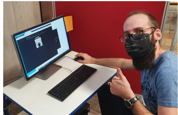
Fig. 2. Défacement du site Web de l'entreprise.

filtre contre les spams n'était mis en place. Le serveur Web comportait une vulnérabilité de type RFI (Remote File Inclusion) sur un sous-espace du site. Enfin, des données confidentielles étaient stockées sur les serveurs Web rassemblant des données nominatives de clients. La machine offensive réalisait des opérations de cartographie du réseau de l'entreprise, des attaques de type Deny of Service (DoS), phishing, défacement du site Web de l'entreprise (Figure 2), attaques par dictionnaire sur les accès SSH des machines, et enfin une attaque de rançongiciel à la fois sur le serveur Web et les postes clients de l'entreprise.