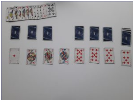
Figure 13 : État final de l'activité, piles visibles