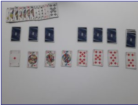
Figure 13 : État final de l'activité, piles visibles