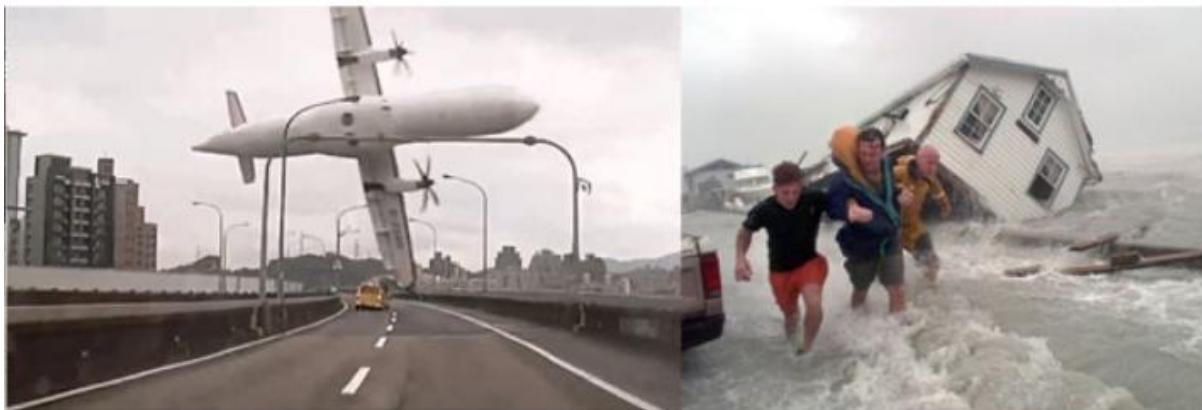
an airplane is parked on the tarmac at an airport

Plus la requête est spécifique à résoudre, plus l'algorithme pourra être efficace car il pourra ajuster son calcul en fonction d'une tâche très précise. A contrario, un résolveur de problèmes qui serait généraliste ne pourrait pas, en théorie, être performant. Super efficaces mais sans aucune intelligence, uniquement dédiés à des tâches spécifiques, et toujours faillibles : voilà ce qui caractérise les mécanismes dits d'intelligence artificielle, loin des images fantasmées par notre imaginaire (v. art. et itw Jérémie Dres).