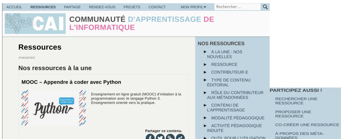
FIGURE 3. Une vue de la page de ressources, on peut rechercher une ressource par recherche textuelle, différentes métadonnées, et il y a aussi la possibilité d'une aide pour rechercher un ressource, en proposer, ou en co-créer.