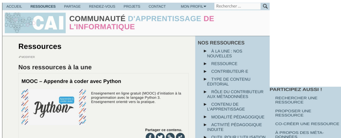
FIGURE 3. Une vue de la page de ressources, on peut rechercher une ressource par recherche textuelle, différentes métadonnées, et il y a aussi la possibilité d'une aide pour rechercher un ressource, en proposer, ou en co-créer.