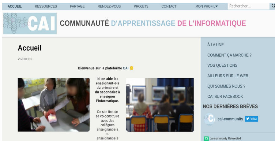
FIGURE 2. Une vue de la plateforme résultat de la réflexion partagées ici et des spécifications proposées, on y voit le choix d'une présentation minimale, les différentes rubriques qui correspondent aux fonctionnalités proposées ici et le lien avec les réseaux sociaux les plus usités par les personnes qui vont l'utiliser.