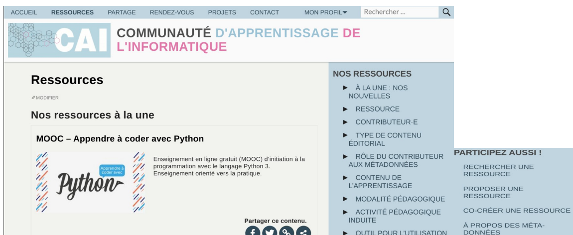
FIGURE 3. Une vue de la page de ressources, on peut rechercher une ressource par recherche textuelle, différentes métadonnées, et il y a aussi la possibilité d’une aide pour rechercher un ressource, en proposer, ou en co-créer.