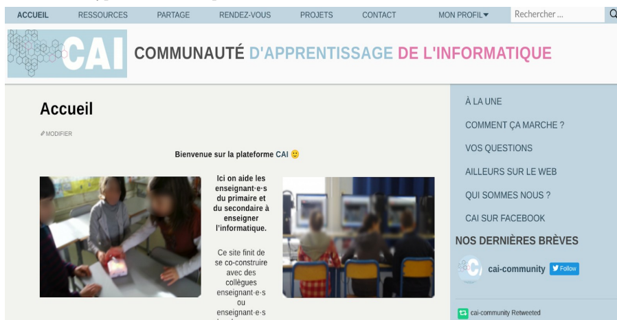
FIGURE 2. Une vue de la plateforme résultat de la réflexion partagées ici et des spécifications proposées, on y voit le choix d’une présentation minimale, les différentes rubriques qui correspondent aux fonctionnalités proposées ici et le lien avec les réseaux sociaux les plus utilisés par les personnes qui vont l’utiliser.