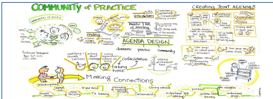
FIGURE 1. Une vue informelle des communautés de pratique : entre réseau social (ouvert et en réseau de manière coopérative et piloté par les opportunités) et équipe projet (structuré, voir hiérarchique, collaboratif et piloté par un objectifs), c'est un partage de connaissance (savoirs), de pratiques (savoir-faire) et de savoir-être; on y apprend ces compétences en "faisant" de manière incrémentale et on y crée et teste de nouvelles idées; repris de https://cflt.ubc.ca/2013/07/25/connecting-communities-of-practice-at-ubc

Dans le cas précis de l'apprentissage de l'informatique pour l'enseigner on peut proposer que le travail soit: