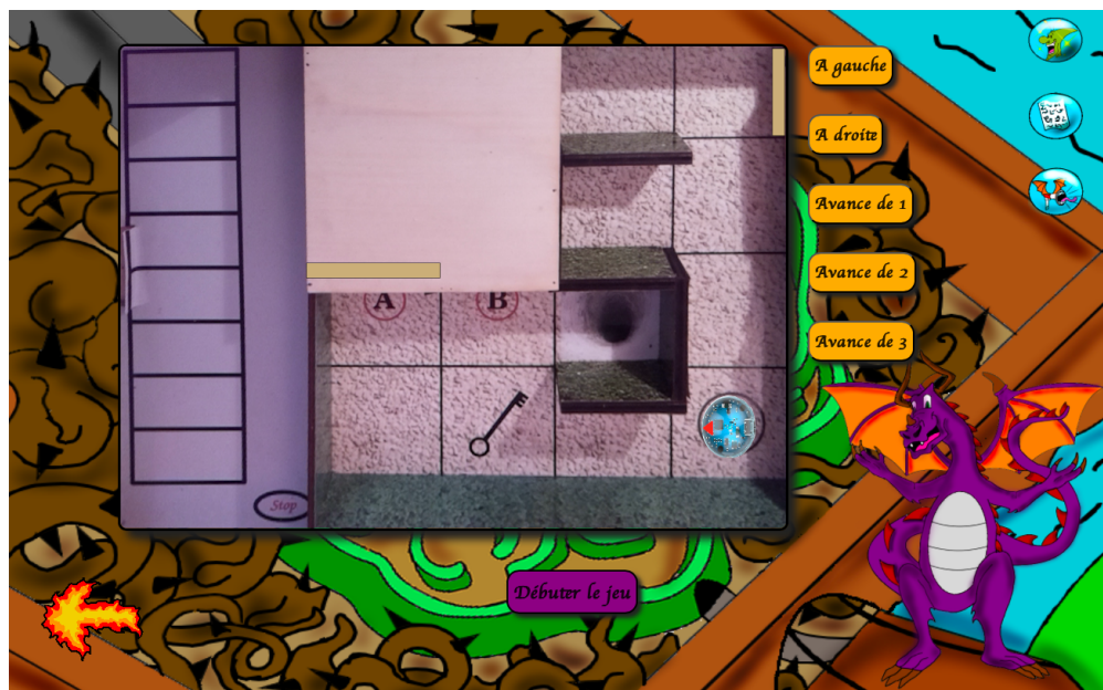
FIGURE 7 – Capture d'écran du simulateur.

Cette capture d'écran montre le canevas du simulateur ainsi que les boutons qui permettent de faire bouger le robot. Ce dernier est représenté par sa photo vue du dessus (en bas à droite du canevas). Les rectangles beiges dessinés sur l'image de fond du canevas sont tracés par-dessus cette dernière afin de représenter les portes. La porte de gauche est placée aléatoirement à la position A ou B. La porte en haut à droite représente la sortie fermée. Le rectangle pivote pour simuler l'ouverture de la porte lorsque le robot s'arrête sur la case contenant la clé. Le tableau sur la gauche représente l'endroit où les plaques d'instructions s'affichent lorsque l'apprenant débute le jeu. Les boutons oranges à droite sont les boutons permettant de mouvoir le robot. Lorsque ce dernier pivote, il le fait sur place et ce sont les boutons "Avance" qui lui permette de changer de case. Le robot devient invisible lorsqu'il passe sous le passage secret et revient au départ s'il tombe dans le trou noir (piège). Lorsqu'un mouvement le fait rencontrer un mur ou une porte close, une notification apparaît et le robot est ramené sur la case où le mouvement a débuté. L'entraînement se termine lorsque le robot est arrivé devant la porte de sortie et que celle-ci est ouverte.