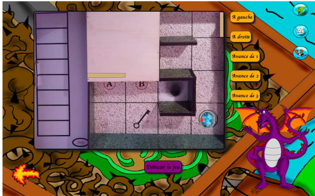
FIGURE 7 – Capture d'écran du simulateur.

Cette capture d'écran montre le canevas du simulateur ainsi que les boutons qui permettent de faire bouger le robot. Ce dernier est représenté par sa photo vue du dessus (en bas à droite du canevas). Les rectangles beiges dessinés sur l'image de fond du canevas sont tracés par-dessus cette dernière afin de représenter les portes. La porte de gauche est placée aléatoirement à la position A ou B. La porte en haut à droite représente la sortie fermée. Le rectangle pivote pour simuler l'ouverture de la porte lorsque le robot s'arrête sur la case contenant la clé. Le tableau sur la gauche représente l'endroit où les plaques d'instructions s'affichent lorsque l'apprenant débute le jeu. Les boutons oranges à droite sont les boutons permettant de mouvoir le robot. Lorsque ce dernier pivote, il le fait sur place et ce sont les boutons "Avance" qui lui permette de changer de case. Le robot devient invisible lorsqu'il passe sous le passage secret et revient au départ s'il tombe dans le trou noir (piège). Lorsqu'un mouvement le fait rencontrer un mur ou une porte close, une notification apparaît et le robot est ramené sur la case où le mouvement a débuté. L'entraînement se termine lorsque le robot est arrivé devant la porte de sortie et que celle-ci est ouverte.