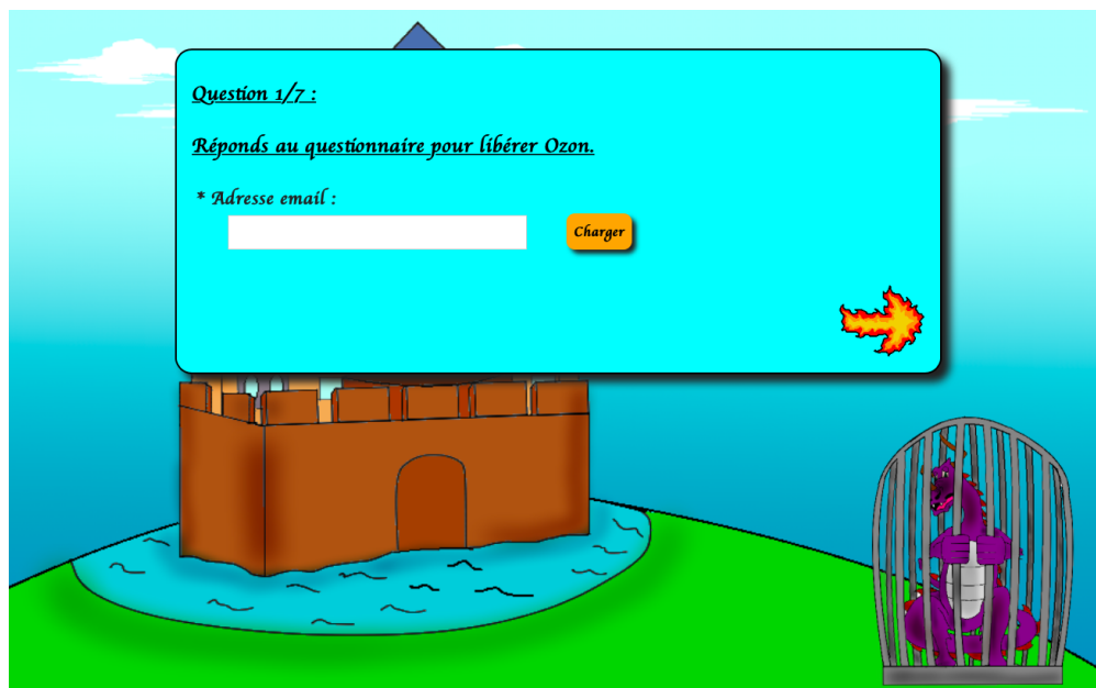
FIGURE 5 – Capture d'écran de la salle 0.

Cette figure montre l'affichage de la salle 0 lorsque l'apprenant clique sur la cage de Ozon. La première division du questionnaire est alors visible et comporte le bouton charger. Le bouton permettant de passer le questionnaire est alors invisible puisqu'il n'y a pas d'adresse saisie. La cage de Ozon ainsi que la flèche de feu sont des images cliquables. Le texte affiché répond à l'utilisation de la fonction fillString() et du fichier string.js .