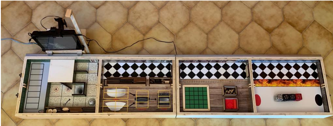
FIGURE 1 – Photographie du jeu d'évasion de table ( tabletop ) [Barnabé et al. , 2020]

Cette image est une photographie du jeu d'évasion sur table conçu par l'équipe du projet AIDE. Comme expliqué précédemment, il s'agit d'un dispositif à bas coût comprenant des composants électroniques et robotiques. Un petit écran équipé d'un processeur ainsi qu'une caméra se déplacent le long du plateau au fur et à mesure que l'apprenant avance dans les activités. Chaque boîte représente une salle distincte avec des objectifs, du matériel et des composants qui lui sont propres. La salle 1 est un labyrinthe avec un Ozobot représentant Ozon. L'apprenant doit créer une séquence d'instructions pour permettre au Ozobot d'arriver jusqu'à la sortie. La salle 2 est une cuisine dans laquelle l'apprenant devra assembler différents ingrédients (variables) pour réussir une recette de gâteau magique qui réveillera les génies endormis dans cette salle. La salle 3 est une bibliothèque avec une paroi magnétique invisible qui empêche les personnalités d'accéder à la sortie. L'apprenant devra alors transmettre et décoder plusieurs images ou séquences en langage machine afin de désactiver la paroi magnétique à l'aide du panneau de sécurité. La salle 4 est en feu et l'apprenant doit concevoir un véhicule autonome en assemblant les quatre CréaCubes devant lui afin de pouvoir s'échapper de la salle en flamme. L'assemblage avance automatiquement lorsque la configuration choisie est correcte.