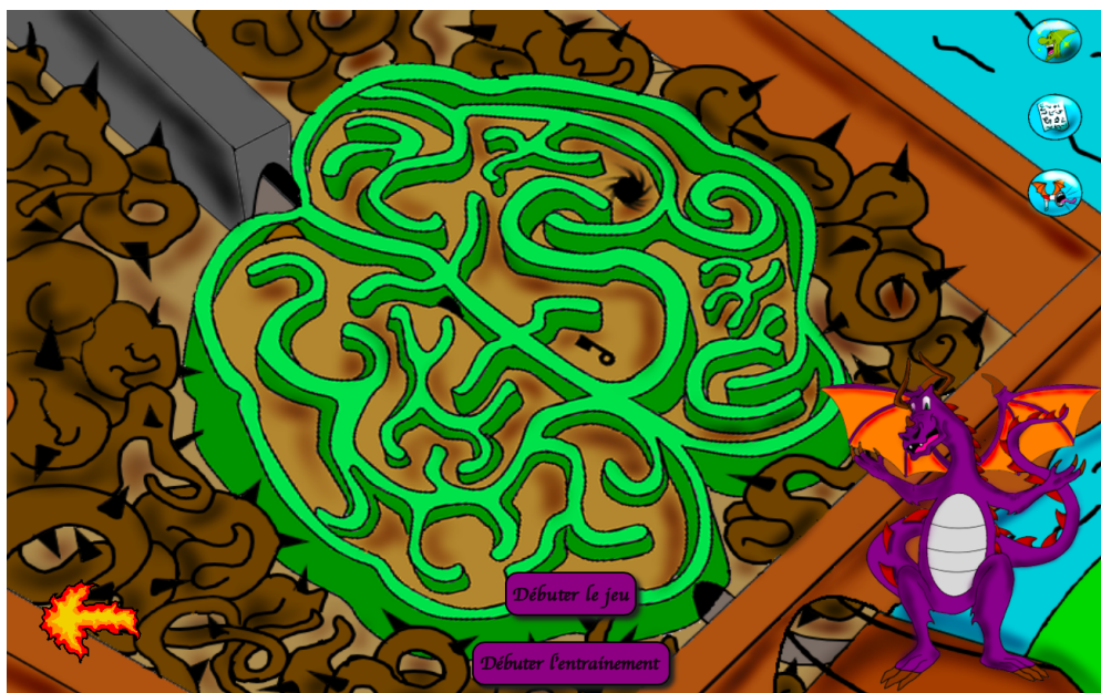
FIGURE 6 – Capture d'écran de la salle 1.

Cette figure montre une capture d'écran de la salle 1. La flèche de feu à gauche permet de revenir à la salle précédente. Ozon est une image cliquable qui permet de répéter la consigne audio. Les trois images en haut à droite sont cliquables et permettent d'ouvrir l'aide (premier bouton en haut avec la tête de Saturnin), d'afficher les consignes au format texte (deuxième bouton en haut avec le parchemin) et de couper/allumer le son (troisième bouton avec le mégaphone magique). Il y a également deux boutons au centre permettant de débiter le jeu (ouvre le canevas et démarre un nouvel audio) ou de faire une séance d'entraînement sur le simulateur.