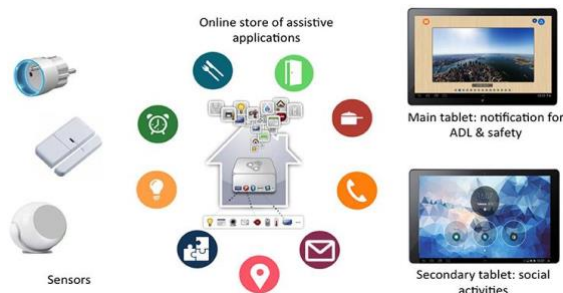
Figure 4 – Matériel et applications services de DomAssist

et d'assistance personnalisables et contextualisées (grâce à des capteurs placés au domicile), couvrant 3 domaines de besoins : lien social, activités de vie quotidienne et sécurité. Les interactions avec l'utilisateur sont uniformisées à l'aide d'une tablette dotée d'un système simplifié de notifications, respectant les normes ISO d'accessibilité et les capacités des personnes à interagir avec une tablette.