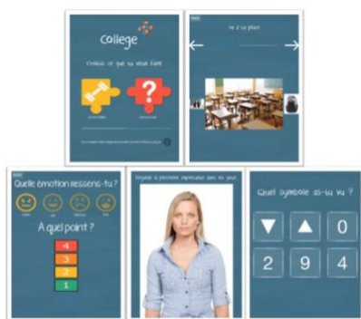
Figure 2 – Illustration des services de l'assistant Collège+

Après une conception participative et une inspection ergonomique (Fage et al., 2016), l'assistant Collège+ sur tablette (Fig.2), visant l'apprentissage des comportements socio-adaptatifs scolaires auprès d'enfants avec Troubles du Spectre Autistiques (TSA) a fait l'objet d'une étude terrain en aveugle auprès de 56 élèves collégiens avec : un groupe TSA équipé, un groupe contrôle TSA non équipé et un groupe équipé avec déficience intellectuelle.