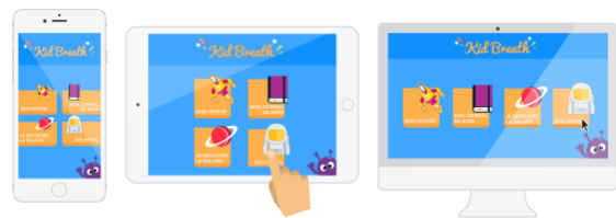
Figure 3 – KidBreath sur plateformes multiples

Dans cette lignée d'approche, un nouvel outil numérique d'éducation à la santé ciblant l'enfant avec asthme chronique a été co-conçu avec toutes les parties prenantes et validé en collaboration étroite avec le pôle de recherche et développement de la société ItWell (Delmas et al., 2018) (Fig.3)